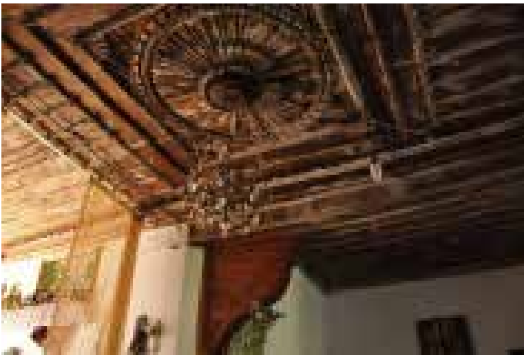
Resim 11.

alır. Bazı örneklerde mekânın bir kısmı yükseltilerek geniş bir seki oluşturulmuştur. Sekiliğin sokağa bakan yüzeyinde sedir yer alır. Böylece mekân sadece pişirme eyleminin gerçekleştirildiği yer olmanın yanı sıra oda işlevi de kazanmıştır. Döşeme kaplaması doğal taştır. Tandır evleri, büyük boyutlu bir ocağın yer aldığı mekânlardır. Genellikle bahçe içinde düzenlenmiştir. Kimi örneklerde tandır evi bölünerek, pişirme hacminin yanında sedirli bir oda oluşturulmuştur. Bina içinde yer alan tandır evleri ise sofa ya da taşlık gibi büyük hacimli bir mekânla bütünleşmiştir.