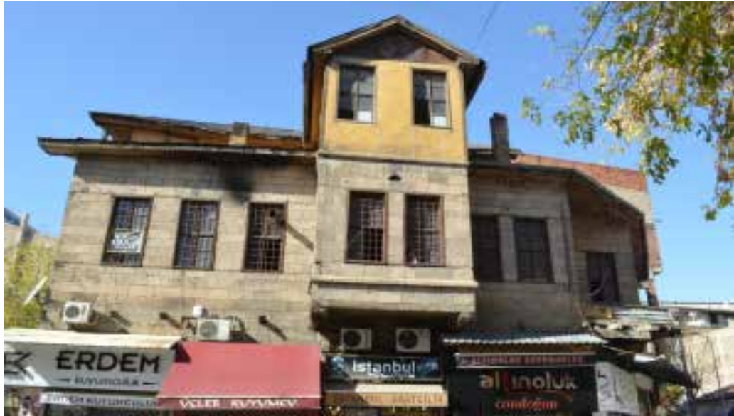
Resim 14.

Niğde evleri, Kapadokya yöresinde, Güneydoğu ve Doğu Anadolu'da görülen evlerle malzeme kullanımı ve cephe özellikleri açısından benzerlikler taşısaya da kendine özgü bir üslup geliştirmiştir. Bu üslubun oluşmasında; birbiriyle uyumlu gelişme gösteren bina kütleleri, kullanılan malzemenin ana cephedeki kararlılığı, yüksek bahçe