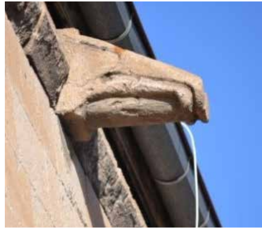
Resim 19.