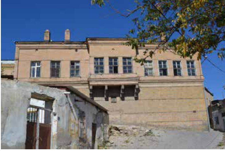
Resim 2.

Aynı zamanda pencere üst ve altlarında kullanılan ahşap hatıllar vasıtasıyla duvar sistemindeki bağlantı kuvvetlendirilmiştir.