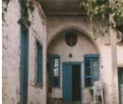
Resim 8.