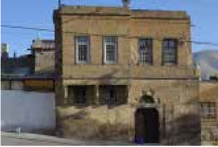
Resim 9.

Dolap kapıları üzerindeki geometrik süslemeler, ahşap kemerle geçilen nişler ve dolap, çekmece kulpları süslemeyi zenginleştiren unsurlardır. Ayrıca sofa ve başoda olarak kullanılan mekânların tavan süslemesi çoğunlukla kirişlemesi alttan kaplamalı tavan şeklinde düzenlenir ve merkezden dağılan ışınal süsleme ile bezenmektedir.