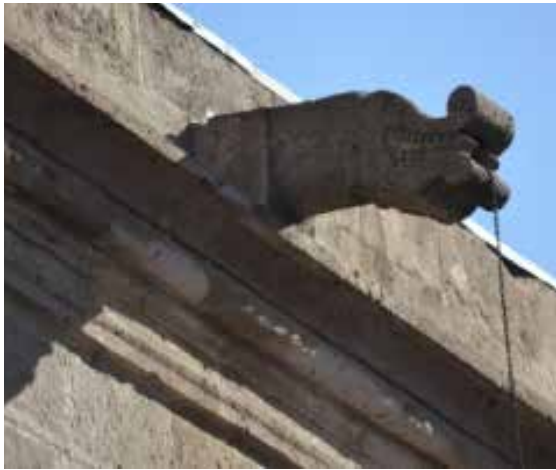
Resim 18. Huriye ALTUNER Fotoğraf Arşivi

Hakkı Eldem'in (1984), bölgesel üsluplar ve ekollere göre yaptığı sınıflandırmaya göre, Kayseri'den Erzurum'a kadar şerit şeklinde uzanan, kerpiç damlı, ahşap hatıllı ve taş duvarlı evler grubuna girmektedir. Kapadokya bölgesi olarak tanımlanan geniş alandaki taş malzeme kullanımı açısından; Şanlıurfa, Diyarbakır, Mardin evlerini akla getirmektedir.