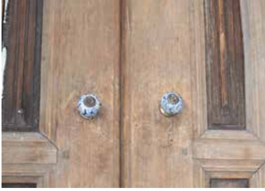
Resim 12.