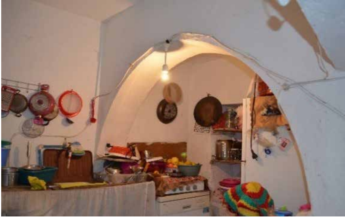
Resim 15

ve avlu duvarlarının kütleler arasındaki bütünleştiriciliği, çok sayıda taş konsollarla taşınan cephe çıkmaları ve eğimli topografyanın sağladığı görsel değişkenlik, esas unsurlar olmuştur. Ev kütleleri arasındaki uyum ve yerleşim düzenindeki saygı, tek düze devam eden bir sokak görüntüsü yerine, son derece hareketli, doluluk ve boşlukları dengeli ve sürprizlerle dolu sokak görüntülerini