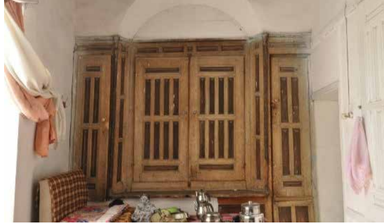
Resim 10.

Niğde konut mimarisinde, mutfak olarak düzenlenen mekânların yanı sıra tandır evleri bulunmaktadır. Mutfakta ocak, niş, raf, tezgâh ve dolap gibi mekân elemanları görülür. Genellikle konutun daha az önemli cephesi yönünde yer