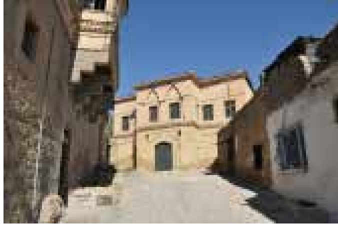
Resim 3.

Kütleli hareketin çok fazla olmadığı Niğde evlerinde cephedeki en önemli unsur çıkmalardır. Çıkmalar konut cephesini zenginleştirdiği gibi ait olduğu sokağın görsel değerini de artırmaktadır. Cumbanın bulunduğu cephe genellikle yapının ana cephesidir. Cephe elemanlarının kullanımı açısından