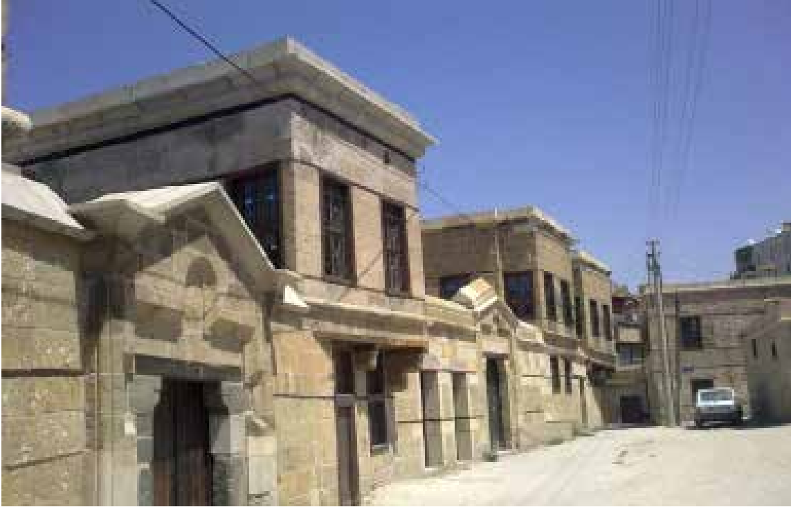
Resim 1.

Niğde Ömer Halisdemir Üniversitesi, Sanat Tarihi Bölümü