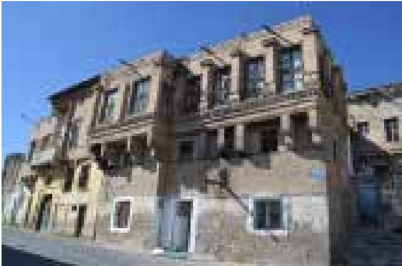
Resim 4.

bir sınıflandırmaya gittiğimizde şu gruplar ortaya çıkmaktadır; “Çok Sayıda Cephe Elemanı Olan Çıkmalı Evler”, “Az Sayıda Cephe Elemanı Olan Çıkmalı Evler” ve “Az Sayıda Cephe Elemanı Olan Çıkmasız Evler”. Çıkmalar, bazen iç hacimle, dış hacmin bütünleşmesini sağlamaktadır. Bunlar, iç mekândan ayrı olarak balkonumsu özellik taşırlar. Dış mekânla ilişkiyi sağlayan bu “Açık Çıkmalar”, cephe tipolojisinde; “Balkon Çıkmalı Cepheler”, “Teras Çıkmalı Cepheler” olarak isimlendirilmişlerdir.