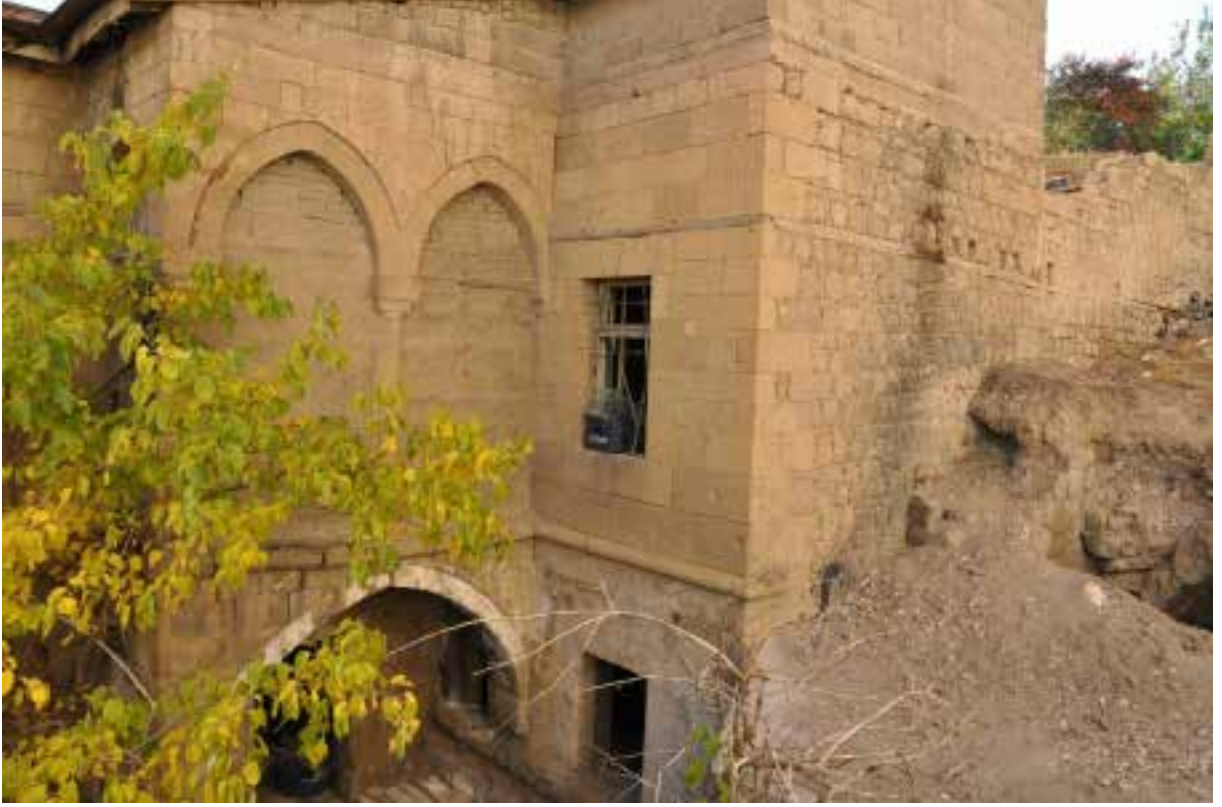
Resim 7.

Tek katlı binalarda yaşama mekânları, servis mekânları, depo, ahır gibi hacimler tüm kata yayılarak, tabanda geniş yüzey kaplayan bir çözümlenmeye gidilmiştir. İki katlı konutlarda sokak ilişkisi dikkate alınarak mutfak, depo, tandır evi gibi mekânlarla, yaşama mekânlarının çok azına zemin katta yer verilmiştir. Üst kat ise tamamen yaşama mekânlarına ayrılmıştır. Yaşama mekânları genellikle dikdörtgen formudur. Yapıların çoğunda, binanın zemine