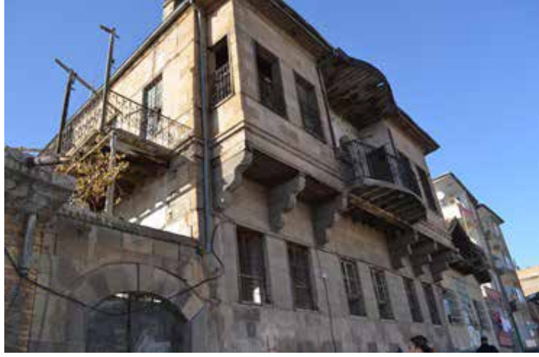
Resim 5.

Çıkması olmayan konut cephelerinin, sütunlar üzerine atılan kemerlerle hareketlendirildiği örnekler de görülmektedir. Köşe parsellerdeki geleneksel yapılarda zemin kat hizasında köşe taşlarının pahlandığı ve sokak dokusunun estetik bir ögesi haline getirildiği görülmektedir. Cephe açıklığı gerektiren mekânlarda taşıyıcı duvarların yanı sıra, açıklığı geçmek amacıyla sütun-kemer sistemi