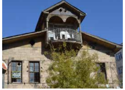
Resim 13.

Depo, ahır, samanlık gibi mekânlar, bahçe içinde yer alan büyük boyutlu eklenti yapı görünümündedir. Geleneksel yapılarda bu tip hacimler tonoz ile örtülmüştür. Bahçesiz konutlarda ise binanın zemin ya da bodrum katında yer alır. Genellikle aynı amaçla kullanılan mağaralarla bağlantılıdır. Sokak cephesinde yer alanlarına, küçük bir kapı ile giriş verilmiştir. Mekânın ışık ve havalandırması mazgal pencerelerle sağlanır. Zemin sıkıştırılmış toprak ya da taş kaplamalıdır.