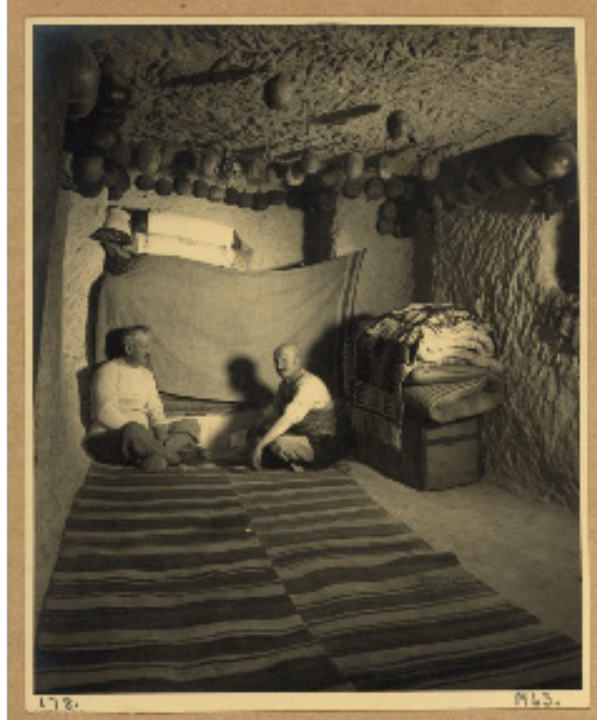
Resim 7. Zelve 1935