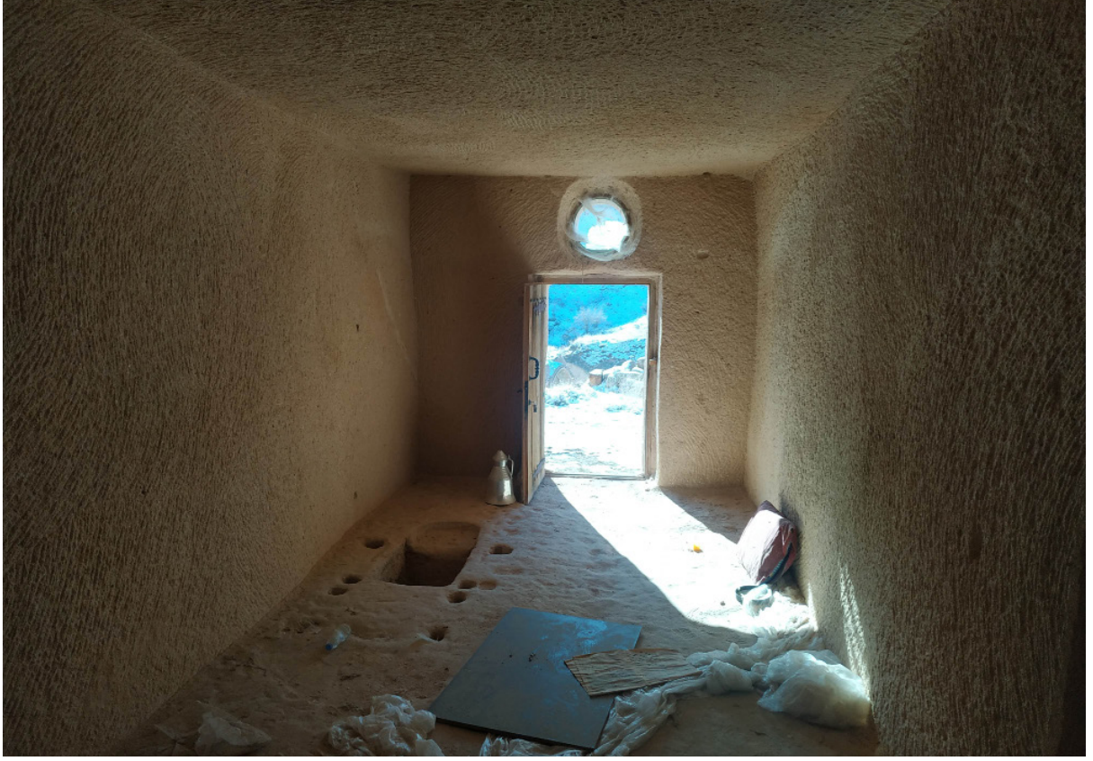
Resim 6. Çavuşin’de Bir Kış Odasında Zemine Açılan Çufalık

Ayrıca duvara açılmış kapaksız süslemeli duvar nişleri de barındırabilmektedirler. Bu nişler, yoğun eşya depolama alanlarından ziyade dekoratif unsurlardır. Tavana oyulmuş kayadan ve işlemeli tavan göbekleri de bu mekânlarda kendine yer bulabilmektedir. Oda girişlerinde, zemini sekiden daha alçak tutulan bir alan mevcuttur. Geleneksel konut mimarisinde bu alan pabuçluk veya seki altı olarak anılmaktadır. Kapadokya bölgesi konutlarında, oda zeminini oluşturan sekinin altında kalan bu pabuçluk alanı yaklaşık 8-10 cm daha alçaktır.