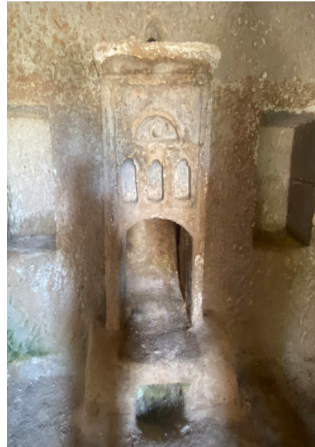
Resim 5. Uçhisar'da Bir Evde Kış Odası

oyma şömine ve bu şöminenin iki yanında bulunan ve simetrik denilebilecek duvar nişlerine sahiptirler. Şömineler, genellikle yaşmaksızdır. Şöminenin iki yanında bulunan nişler ise genellikle dikdörtgen biçiminde düz açıklıklar olup kapaksızdır. Kimi zaman niş içine ahşap raflar yerleştirilebilmektedir. Nişlerden birisi yunmalık nişi olarak da düzenlenebilmektedir ve oda içi banyo niteliğindedir. Kış odasının bir diğer karakteristik özelliği ise odanın zemininde odanın üç cephesi boyunca oturma sekisinin biçimlendirilmiş olmasıdır. "U" biçiminde odayı dolaşan bu kaya sekinin ortası daha alçakta tutulmaktadır. Geniş bir seki altı oluşturulmuştur. Dışa kapalı, içe dönük olan kış odaları pencere bakımında zengin değildir. Pencere yalnızca avlu cephesinde bulunur ve bu odalar dışa kapalı yaşam alanlarıdır. Az pencere açılımı ısı kaybının da önüne geçer. Sade sayılabilecek kış odalarında, süsleme unsurları şömineler üzerinde kendisine yer bulabilmektedir.