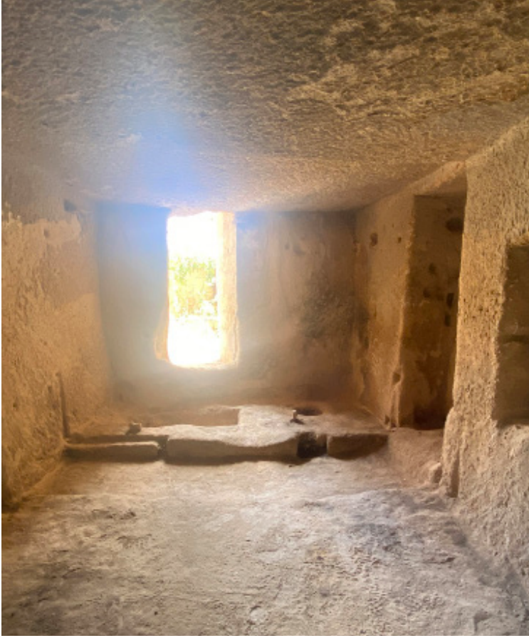
Resim 3. Uçhisar'da Bir Evde Kış Odası

Anadolu'nun pek çok coğrafyasında görülmeyen bu kış odaları, kolay ısıtılmaları sayesinde ailelerin temel yaşam odası hâline gelmiştir. Kendi içinde detaylara sahip olan bu odalar, içine girildiğinde genel karakteristiğini sergilemekte ve diğer mekânlardan kolayca ayrılmaktadır. Kayadan oyulmuş bu odaların, kış odası olarak adlandırılmasının nedeni ise kayanın, mekânı doğal iklimlendirme etkisine bağlanmaktadır. Dışarıdaki havanın tersinin yaşandığı kaya mekânlar, yazın serin kışın sıcak olan mekânlardır ve bir şömine ile ısıtılması oldukça kolaydır. Kış odalarının yer seçimlerinde bir kurala bağlanmamış olmakla birlikte genellikle kaya oyma ahırla bitişik oldukları görülür. Kış odası ve ahırın bu yakın konumundan olsa gerek kış odalarının bölgesel