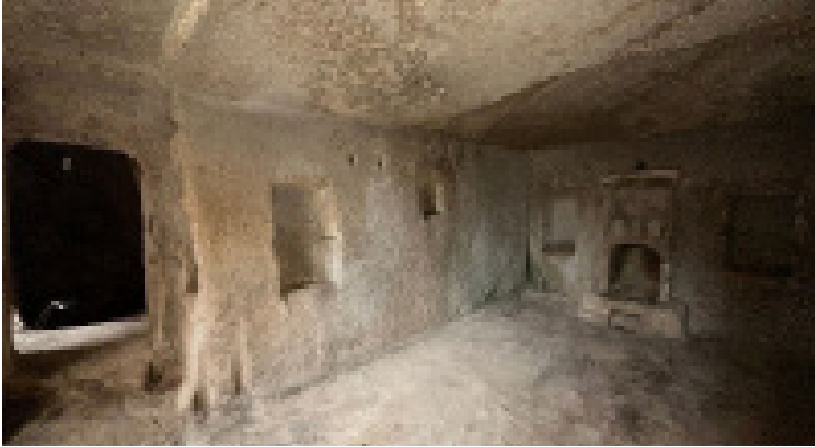
Resim 1. Uçhisar'da Bir Evde Kış Odası

Nevşehir Hacı Bektaş Veli Üniversitesi, Sanat Tarihi Bölümü