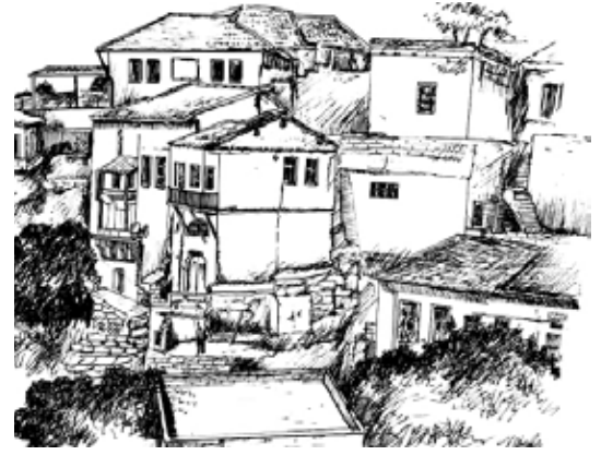
Çizim 6. Osman AYTEKİN