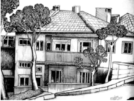
Çizim 3. Osman AYTEKİN