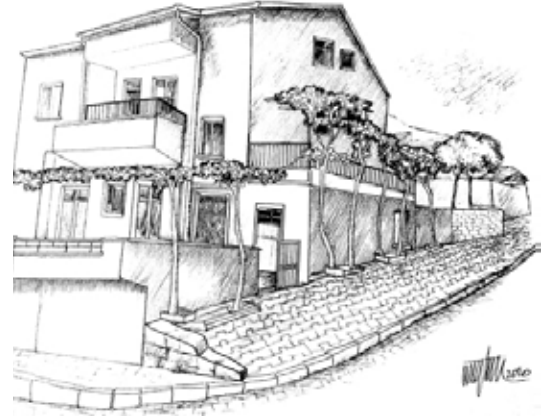
Çizim 4. Osman AYTEKİN

göçer durumdaki aşiretlere öncelik verilmiştir. Boynu İnceli Türkmenlerine mensup oymak ve cemaatlerin 800 hane seçilerek şehir merkezine, kalan grupların da köylere iskânı gerçekleştirilmiştir. Nevşehir'e yerleştirilen göçebe grupların yaşayacağı evlerin inşa edilmesi için arsalar verilmiştir. Şehre yerleştirilenlerin göç etmemeleri için de bazı tedbirler alınmıştır. İskân hareketleri sonucu 1730 yıllarında Nevşehir artık bir kasaba hâline gelmiş ve 1840'taki idarî düzenlemelerde, Nevşehir, Niğde sancağının kazaları arasında yer almıştır.